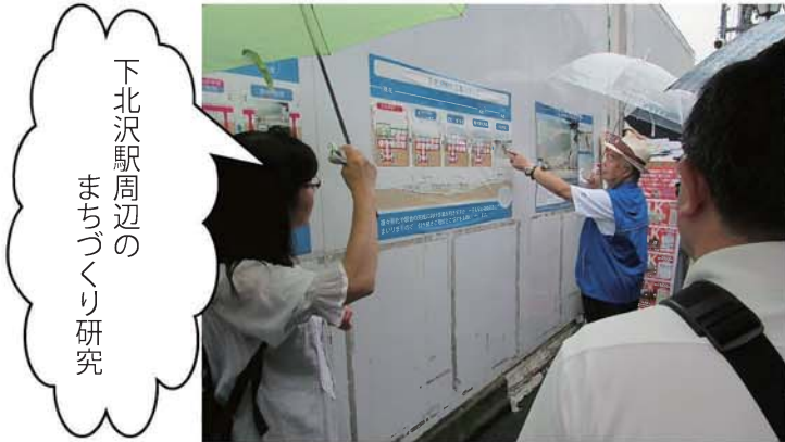
下北沢駅周辺の まちづくり研究

駅と線路の地下化を契機に、駅前広場や線路敷跡地の利用方法を中野区や西武鉄道へ提案する為の準備をしています。新井薬師前駅活性の為に、下北沢・国領・武蔵小山の各駅前周辺の「まちづくり」の実情を研究しています。