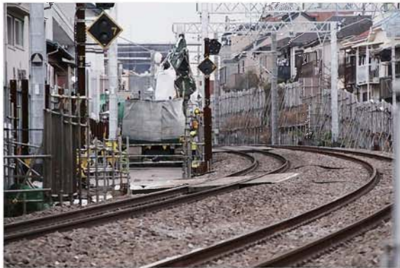
地下トンネル掘削地横の線路