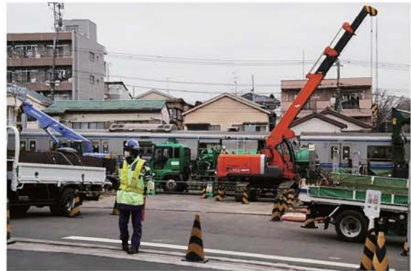
地下トンネル掘削タテ坑工事中