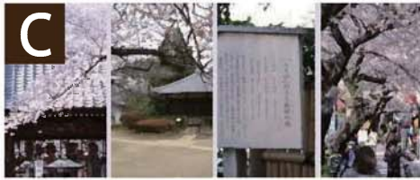
C ● 人を呼込む 仕掛けと施設、 イメージ戦略と構築