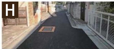
H ● 狭あい道路の拡幅