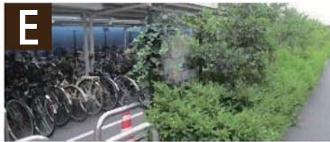
E ● 地下化による駐輪場 や散歩道の確保