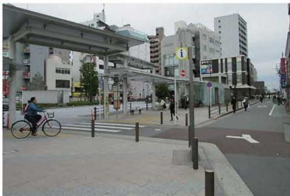
(例) 駅前ロータリー