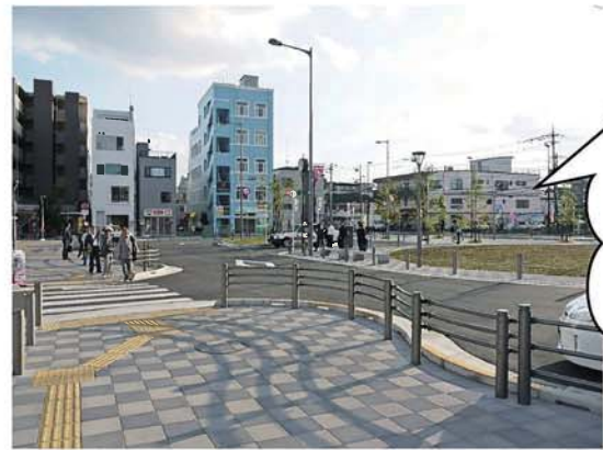
布田駅周辺の まちづくり研究