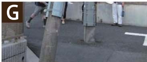
G ● はみ出た電柱 の撤去・移設