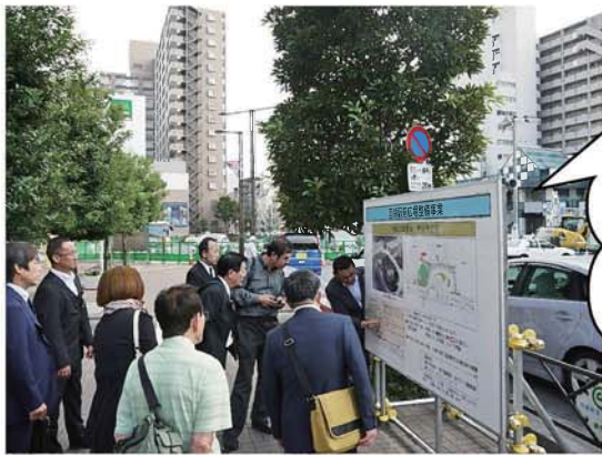
国領駅周辺の まちづくり研究