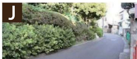
J ● 緑化の推進