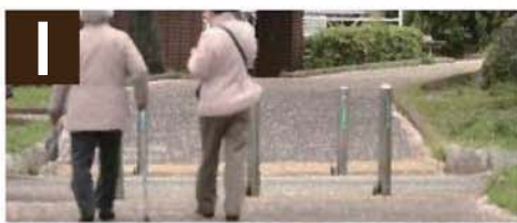
I ● 世帯の高齢化