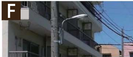
F ● 街灯の整備等による 防犯性の向上