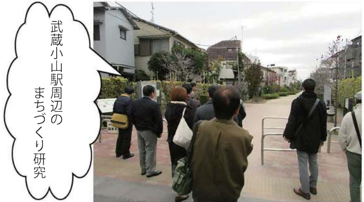
武蔵小山駅周辺の まちづくり研究