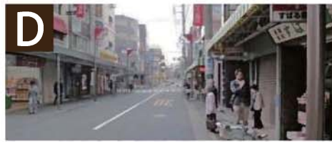
D ● 駅周辺とのにぎわいの 連続性の確保