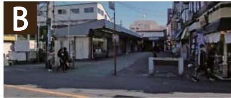
B ● 駅の玄関口 利便性向上