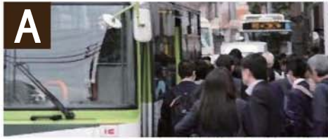
A ● 歩行者の安全確保