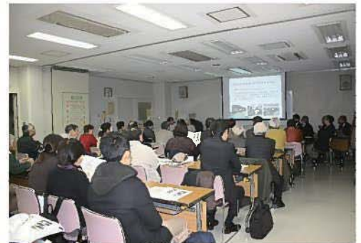
住民説明会の様子(平成28年11月)

●今後は、鉄道跡地利用等上記の内容についてより具体的なイメージをまとめると共に、駅を中心とした生活圏を拡大してまちづくりに直接かかわる部分の検討を進めていく予定です。