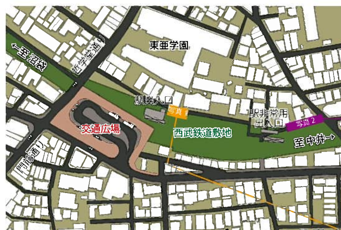
図4 新たな駅周辺のイメージ図