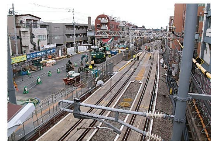
写真2、駅北側東部エリア