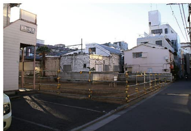
写真1、駅北側中央部エリア