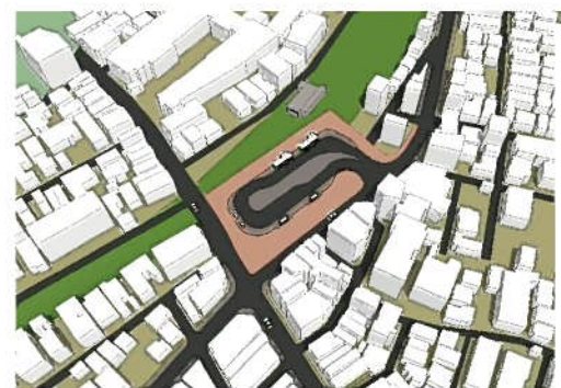
図2 駅前交通広場の俯瞰図