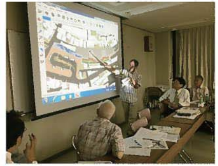
検討会の様子(平成28年6月、8月)

●平成28年9月には、西武鉄道株式会社「駅及び駅舎の機能」について、また中野区長に「交通広場の機能」について、それぞれまちづくりの観点から行った検討内容を当会の提案書として提出しました。